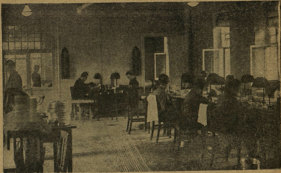
Лаборатория Ленингр. ф-ки Совкино. Монтажная

Группой практически намечено изучение кинозрителя, городского и деревенского, в обычных и специально созданных экспериментальных условиях, и постановка организованного учета зрителей и их запросов.